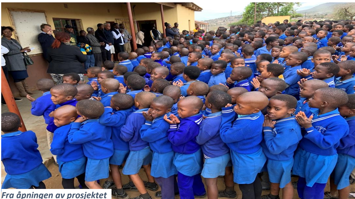
Fra åpningen av prosjektet

Formål: Safe drinking water in public school and water for community gardens.