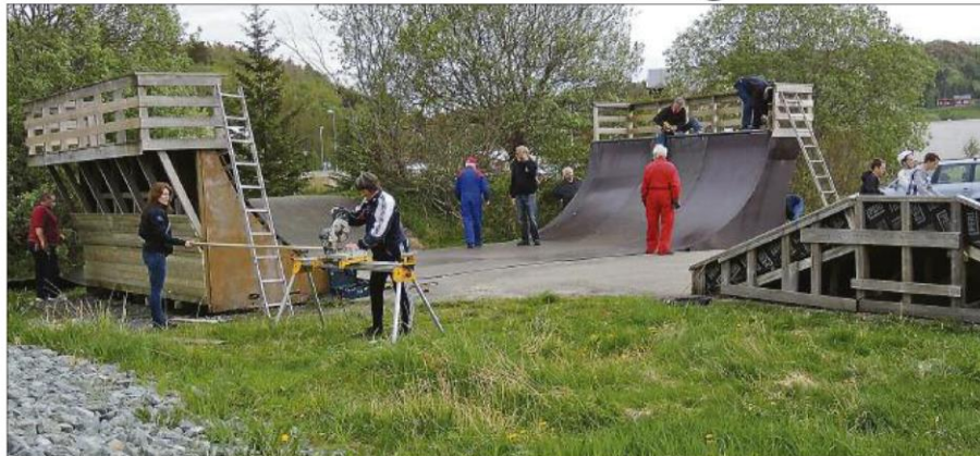
REPARASJONSARBEIDET er utført av Rotary-medlemmer over to mandagskvelder.

BJUGN: Skateboardbanen i Botngård er igjen en trygg lekeplass for ung-