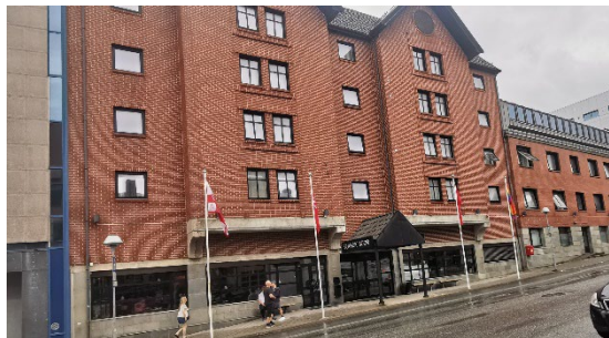
Hotellet under Distriktskonferansen, - Scandic Bodø Hotellet ligger sentralt i byen

Rotarianere er mennesker som vil hverandre vel og støtter opp om hverandre, og som bidrar positivt til samfunnet rundt seg. Bedre kan det ikke bli!