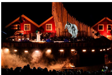
Fra åpningsseremonien, ved markering av Bodø som Europeisk Kulturhovedstad.

Vi har tema om ungdomsutveksling/Ryla. Etikk blir diskutert i et interessant panel. Hilsener fra RI President og Sone Direktør. Små video presentasjoner om hva som blir gjort i Rotary rundt omkring i verden. En representant fra magasinet Rotary Norden vil være til stede.