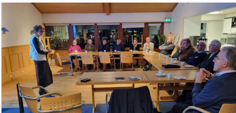
Gode diskusjoner mellom medlemmer fra Tromsø RK og Tromsø Arktisk RK

En formiddagsklubb og en ettermiddagsklubb med forskjellig fokus og profil.