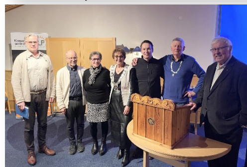
Styremedlemmer fra Tromsø RK, Tromsø Arktisk RK sammen med AG og DG