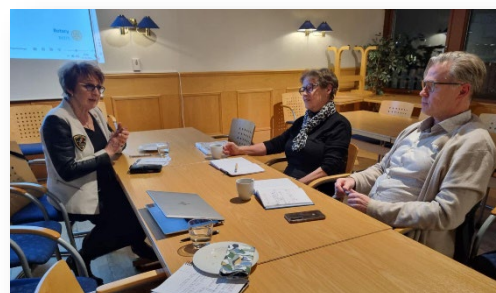
Styremedlemmer i Tromsø RK

Et godt møte med dem sammen, tror jeg alle syntes var positivt. Det kan være lettere å bli enige om å gjøre ting sammen og bidra til hverandres arbeid om man treffes fysisk.