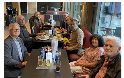
Sosial hygge etter klubbmøte i Surnadal Rotaryklubb