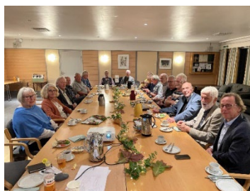
Frei RK som også inviterte medlemmene fra Kristiansund RK til nydelige snitter og hyggelig stemning