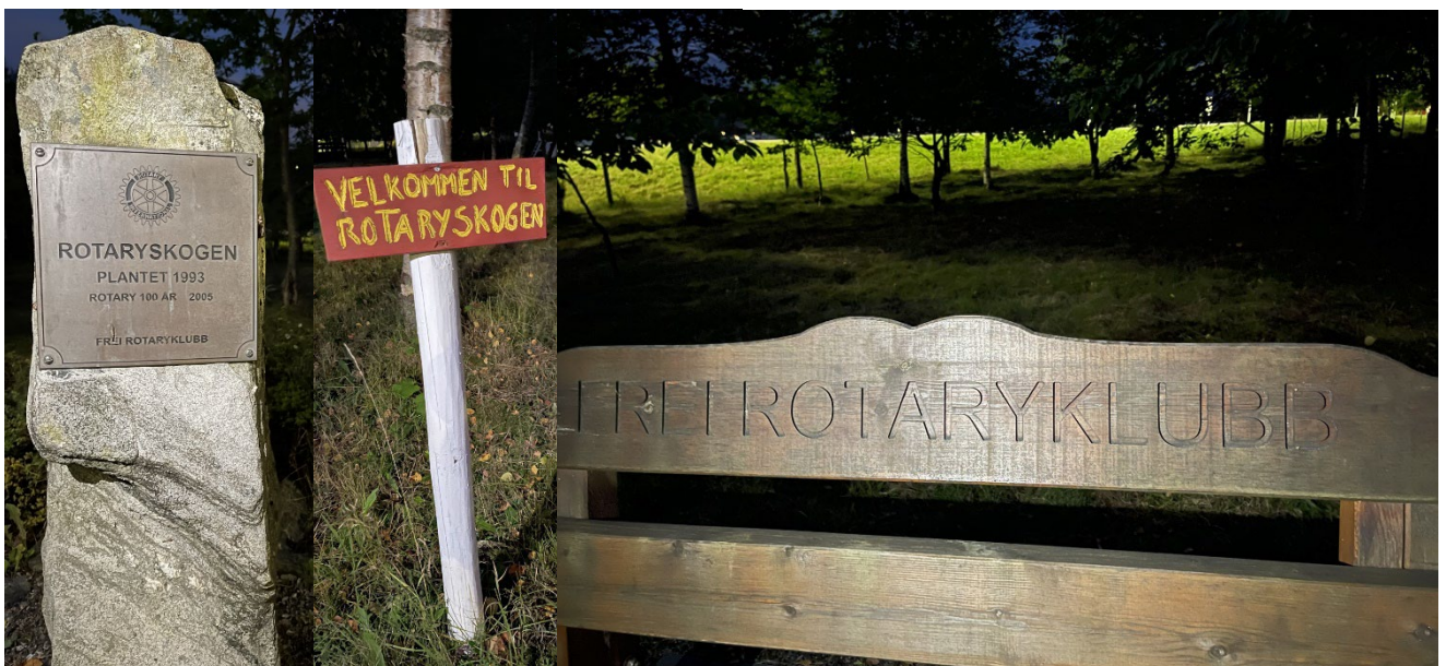
Frei Rotaryklubb har siden 1993 hatt et prosjekt i Rotaryskogen. Prosjektet er flott markedsføring av Rotary, og arbeidet som gjøres. Her kan man hvile seg på en Rotary benk.

Lenke til webinarerene: meet.google.com/vxv-qxtr-fbp