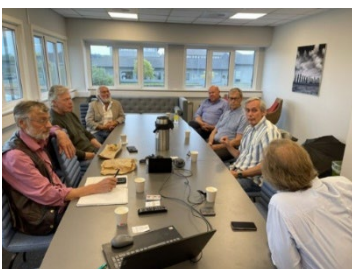
Møte med Løkkemyra RK som er under etablering

Tema fra min side har vært nytenking angående rekruttering og fokus på prosjekter.